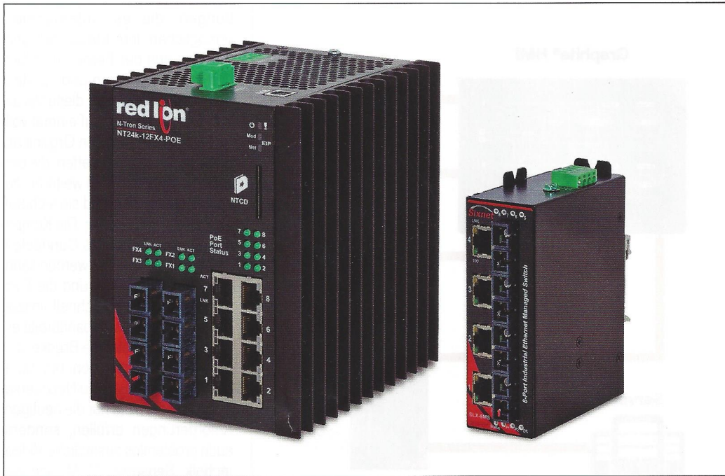
NT24k-12FX4-POE- und SLX-8MS-Schalter

Netzwerken, Daten schneller zu senden, und erlaubt dem Netzwerk außerdem, größere Dateien (zum Beispiel höherauflösende Bilder) zu transportieren, ohne dass es zu Dienstqualitäts- oder Leistungsproblemen kommt.